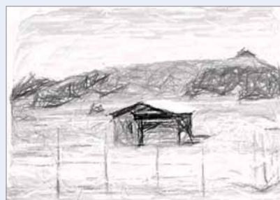
So wohnt eine ganze Familie in Ostafrika; eine nachempfundene Zeichnung von jemandem, der SALEM-Uganda und das Land selbst besucht hat.