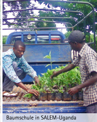
Baumschule in SALEM-Uganda