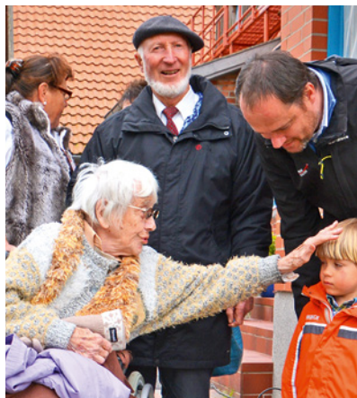
Mehrgenerationen-Projekt in SALEM-Kovahl