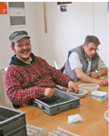
Arbeitstherapie in SALEM-Höchheim

In SALEM-Kovahl in Niedersachsen leben vorwiegend Kinder mit traumatischen Erfahrungen. Unser Ziel ist es, ihrem Leben eine geregelte Struktur und eine neue Perspektive zu geben. Erwachsene mit psychischen Erkrankungen, die Unterstützung im täglichen Leben brauchen, finden in der Lebensgemeinschaft SALEM-Neestahl eine Heimat. www.salem-kovahl.de