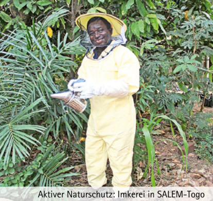
Aktiver Naturschutz: Imkerei in SALEM-Togo