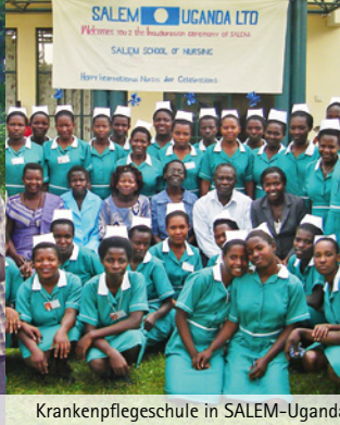
Krankenpflegeschule in SALEM-Uganda