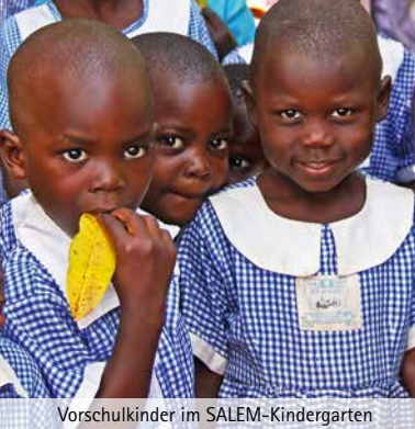
Vorschulkinder im SALEM-Kindergarten