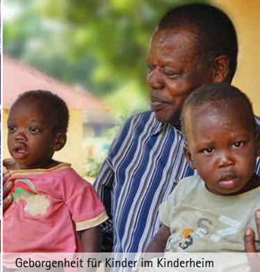
Geborgenheit für Kinder im Kinderheim