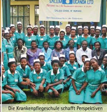
Die Krankenpflegeschule schafft Perspektiven