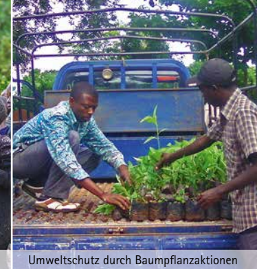
Umweltschutz durch Baumpflanzaktionen