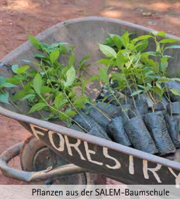
Pflanzen aus der SALEM-Baumschule