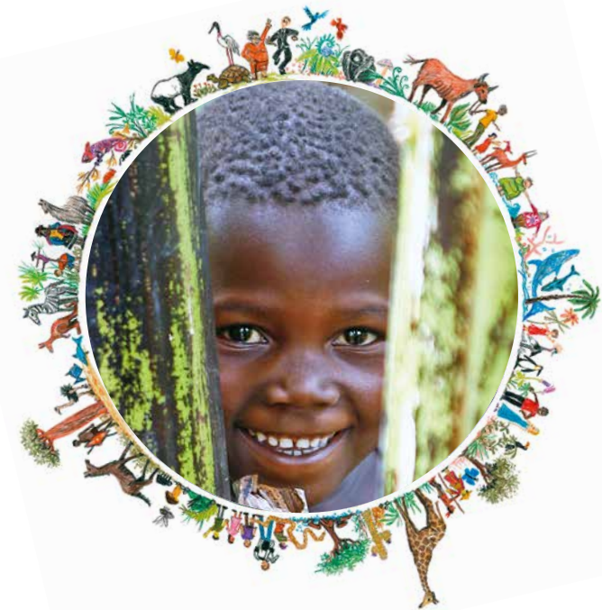
Design: queens-design.de Illustrationen: Stefan Hage