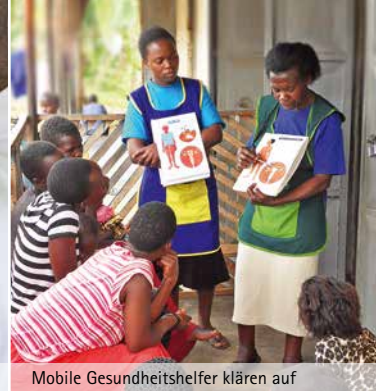
Mobile Gesundheitshelfer klären auf