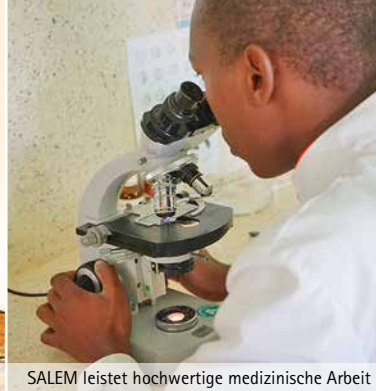
SALEM leistet hochwertige medizinische Arbeit