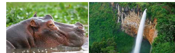
Faszinierende Natur in Uganda

Das SALEM-Gästehaus mit Konferenzzentrum bietet Besuchern die Möglichkeit, unsere Arbeit persönlich kennenzulernen und die regionale Kultur zu erleben. Alle Gewinne werden für den Ausbau und Erhalt der SALEM-Aktivitäten verwendet. Kontaktieren Sie uns, wenn Sie mehr erfahren möchten.