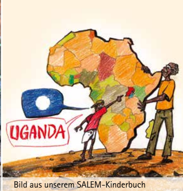
Bild aus unserem SALEM-Kinderbuch