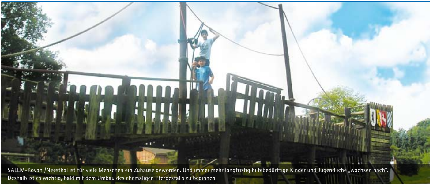
SALEM-Kovahl/Neesthal ist für viele Menschen ein Zuhause geworden. Und immer mehr langfristig hilfebedürftige Kinder und Jugendliche „wachsen nach“. Deshalb ist es wichtig, bald mit dem Umbau des ehemaligen Pferdestalls zu beginnen.