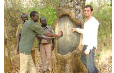
Ein Baum dient als Schultafel

SALEM organisiert Trainings u.a. in den Bereichen Land- und Forstwirtschaft sowie Vermarktung. Planung und Selbstorganisation sind entscheidend, um eine solide Basis