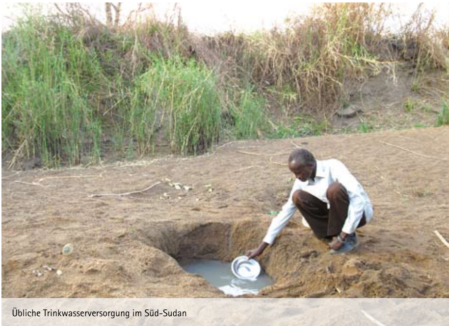
Übliche Trinkwasserversorgung im Süd-Sudan

Über 20 Jahre Bürgerkrieg haben das Land fast völlig verwüstet. Zwar herrscht seit 2005 offiziell Frieden; Infrastruktur, Gesundheits- und Bildungswesen liegen aber weiterhin am Boden. Großen Teilen der Bevölkerung fehlt es an Wissen und Möglichkeiten, um die eigenen, prekären Lebensbedingungen zu verbessern.